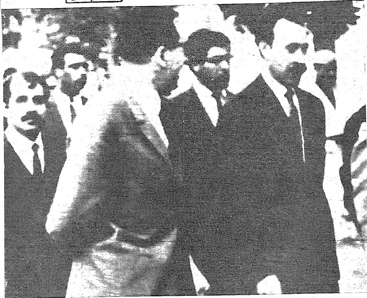
الرئيس الجزائري هواري بومدين ومقاربه المستشفى على اثر محاربه اغتياله بينما كان في سيارته واصابته في وجهه